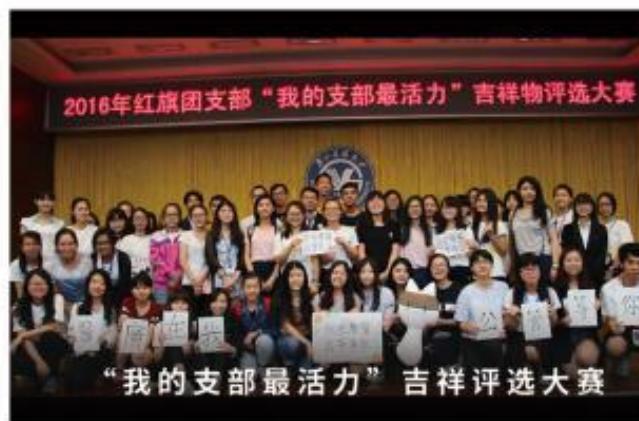
“我的支部最活力”吉祥评选大赛