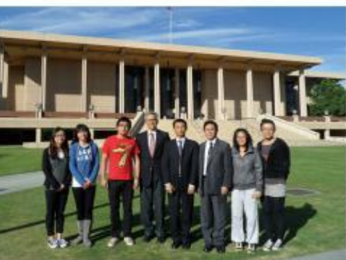
学校与公管在美学生合影

已有六批共18名学生到美国加州州立大学北岭分校就读，其中，16名学生已顺利毕业，并已拿到广医和美国北岭分校管理学学士双学位证书。