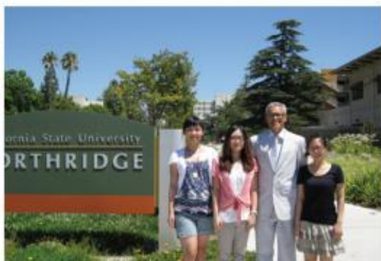
在美公管学生在外情况